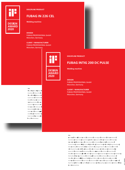
INTIG 200 DC PULSE / аппарат аргодуговой сварки

* iF Design Award / Германия/ – всемирно известный международный конкурс в области промышленного дизайна. Является старейшей независимой дизайнерской наградой в мире. Логотип iF Design символизирует признание продукта исключительным образцом международного уровня. В конкурсе iF Design Award приняли участие более 7.200 номинантов из стран. В состав международного авторитетного жюри вошли 78 эксперта по промышленному дизайну.